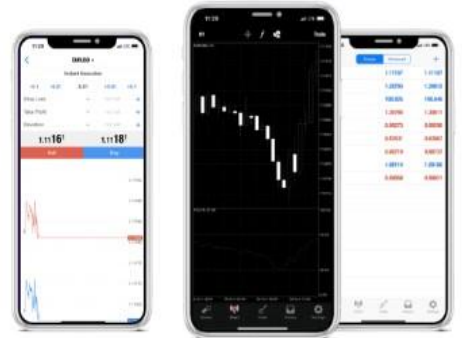
IOS Trader - MT5