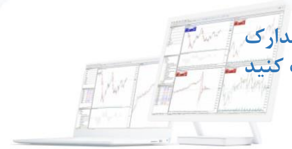
Desktop Trader - MT5